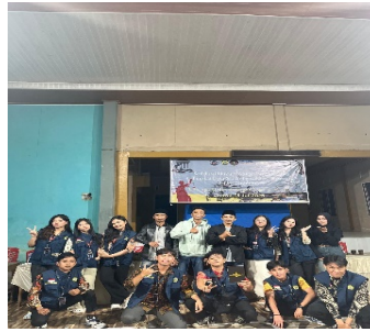
Gambar1.2 Foto Bersama Kelompok KKN 248 Desa Sambirejo & Perangkat Desa Sambirejo